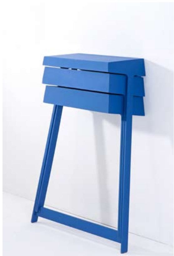
Boven Zitelementen uit de Volume-serie van Yael Mer. Midden De vorm van de Milk Cartons verklapt het vetgehalte van de melk. Onder Arco heeft het ladekastje Pivot in productie genomen.